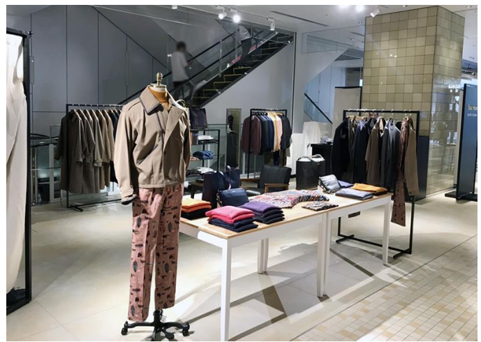
(渋谷スクランブルスクエアPOP-UP SHOP写真)