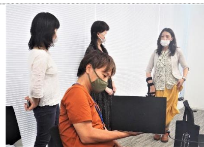
障がいのある方から困りごとを教えてもらいながらアイデアをまとめる。(三陽商会本社にて)