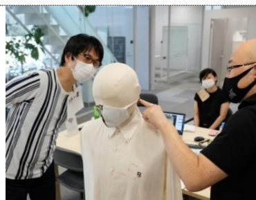
プロのパタンナーと共に困りごとを具体的な形に。(ワールド北青山ビルにて)