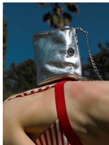
¥43,450 シルバー 牛革 (イタリアンヴィンテージレザー)