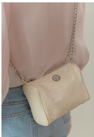
¥39,600 MUアイボリー、MUブラック 牛革 (イタリアンヴィンテージレザー)