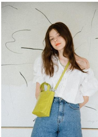
¥29,150 アップルグリーン、ブラウン 牛革 (イタリアンヴィンテージレザー)