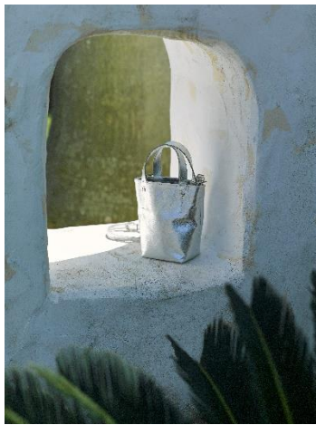
¥31,900 シルバー 牛革 (イタリアンヴィンテージレザー)