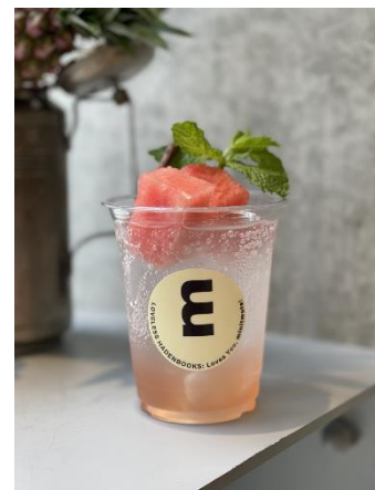
コラボレーション酵素ドリンク

通常販売の他、「ラブレス青山」にて「minitmute」をお買い上げのお客さまに先着順にて無料でコラボレーション酵素ドリンクをプレゼントいたします。