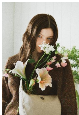
¥18,150 モカベージュ、ブラック ナイロンヘビーツイル