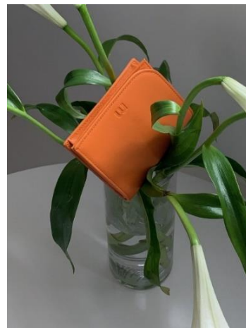
¥16,500 エッグスープ、キャロット、トナピンク エッグスープ&キャロット/ 牛革 (イタリアンヴィンテージレザー) トナピンク/牛革 (コリア)