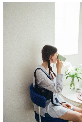
韓国発バッグブランド「minitmute」