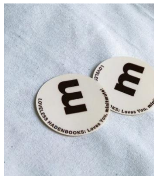
minitmute購入者限定配布のポストカードセット（左）&ローンチ記念ロゴステッカー（右）