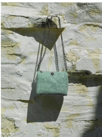
¥45,650 キャビアブルー 牛革 (イタリアンヴィンテージレザー)