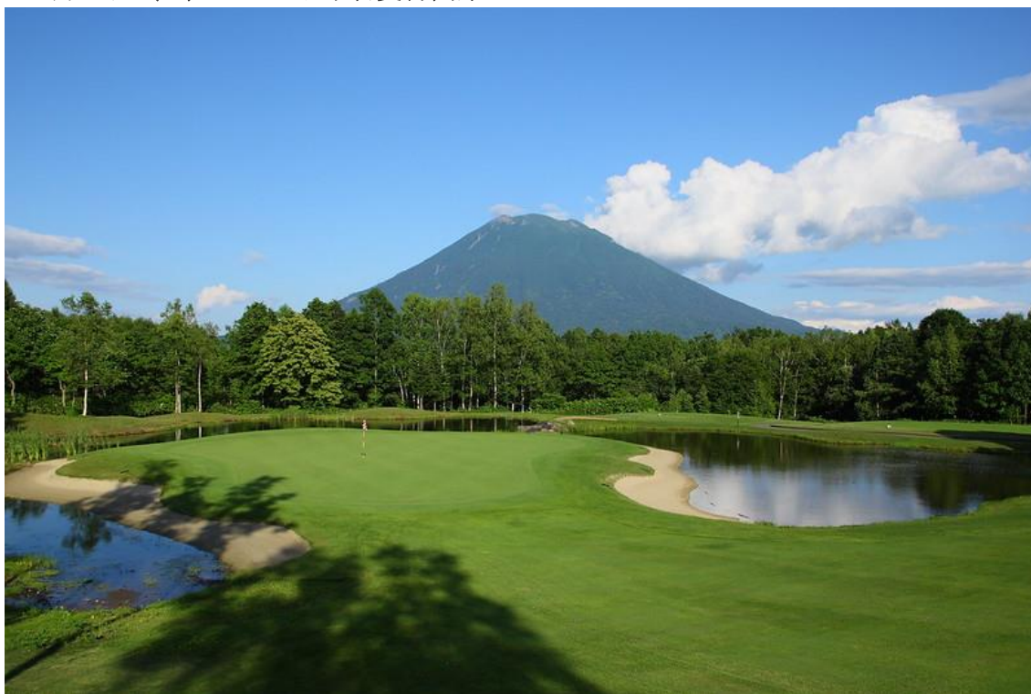
ニセコビレッジ ゴルフコース