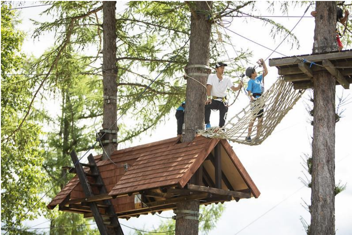
ツリートレッキング