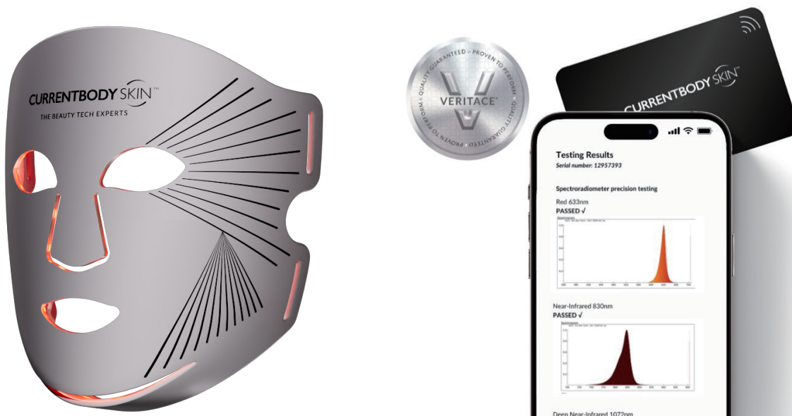
画像：カレントボディ (2024)

英国発の美容機器ブランドでビューティーデバイスのパイオニアであるCurrentBody（本社：英国マックルズフィールド、カレントボディ・ジャパン合同会社、創業者兼CEOローレンス・ニューマン、以下「カレントボディ」）は、LED光美容デバイスの保証の見える化を実現した、独自のLEDデバイス品質保証制度「Veritace® (ヴェリタス)」を開始します。また、本制度初の認証マーク搭載製品「CurrentBody Skin LEDライトセラピーマスクシリーズ2」を10月16日(水)より発売いたします。