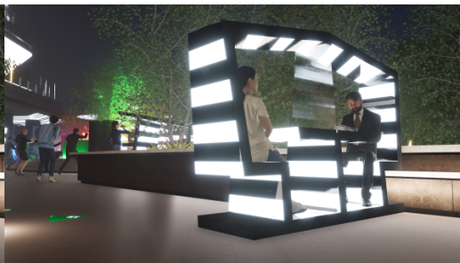
ヴァーチャルイメージ ※実際とは異なる場合があります。