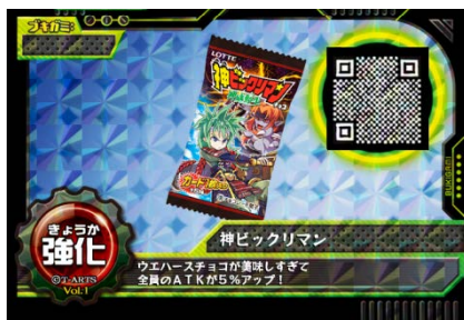
アイテム「神ビックリマン」