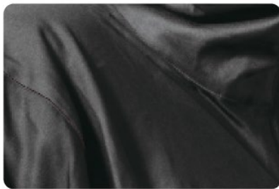
▲テカリが目立つポリエステル生地

ポリエステル100%ですが、化学繊維特有の生地のテカリもなく、綿タッチでマットな色合いとなっています。