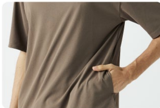
左右隠しポケット

胸ポケットではなく、両脇ポケットを付け小物がサッと収納できるTシャツとなりました。隠しポケットをつけております。