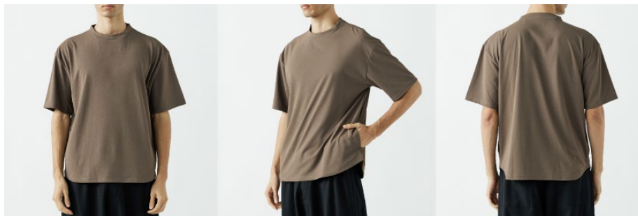
▲ 68.アッシュブラウン