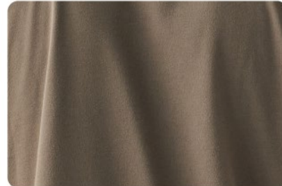
▲綿タッチドライ加工のポリエステル生地