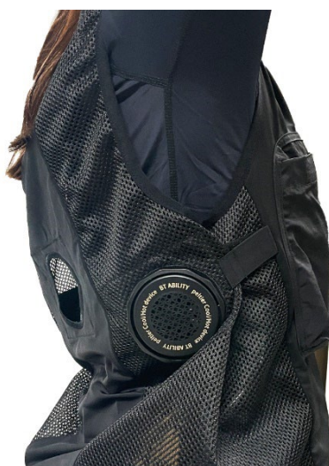
▲サイズ調整の面ファスナー付き