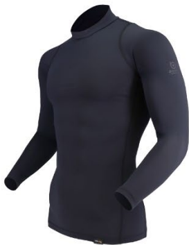
JW-727 EVO バックハイネックシャツ