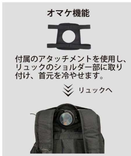
▲リュックに取り付けて首元を冷やせます。冬場はカイロ代わりに