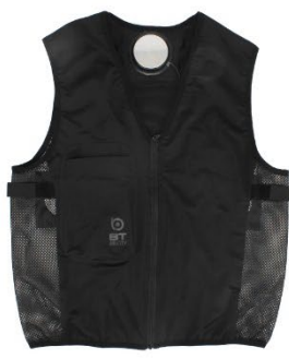
JW-699 ペルチェ冷暖ベスト