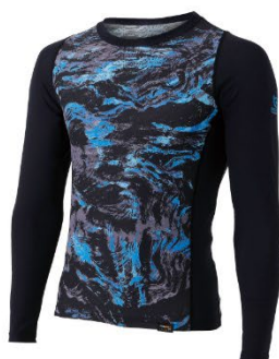
JW-726 EVO クルーネックシャツ