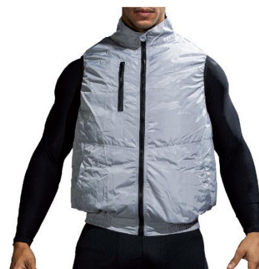
ファン付きウェア