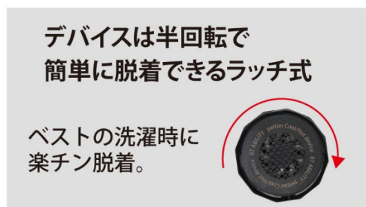
▲デバイスは簡単に脱着可能