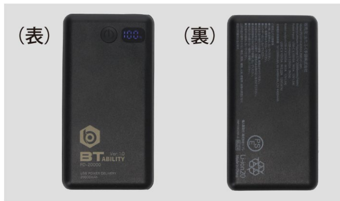
▲熱を帯びにくいPDバッテリー（充電残量表示付き）