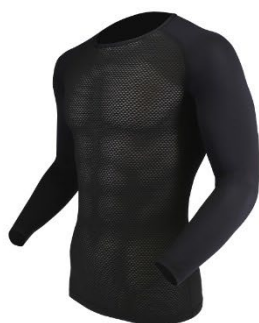
JW-715 冷感3Dファーストレイヤー