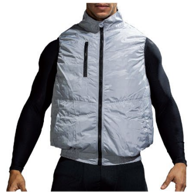
ファン付きウェア