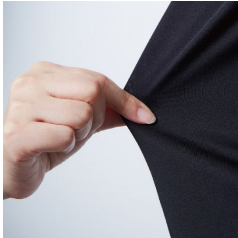
BT パワーストレッチ

生地には縦横に伸縮するストレッチ素材を使用し、頭部にフィットしやすい設計としています。 また、後方カバーにより首筋の日差し対策としても使用可能です。