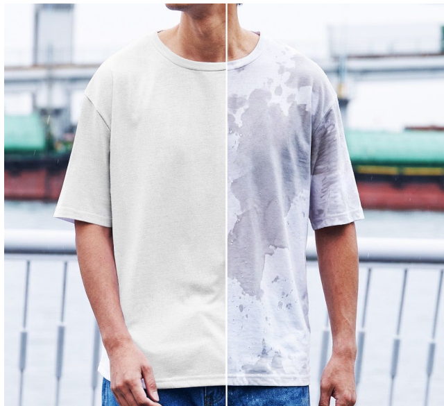
左側：汗染み軽減Tシャツ