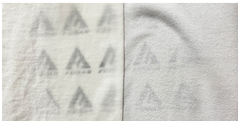
左側：一般的な綿生地