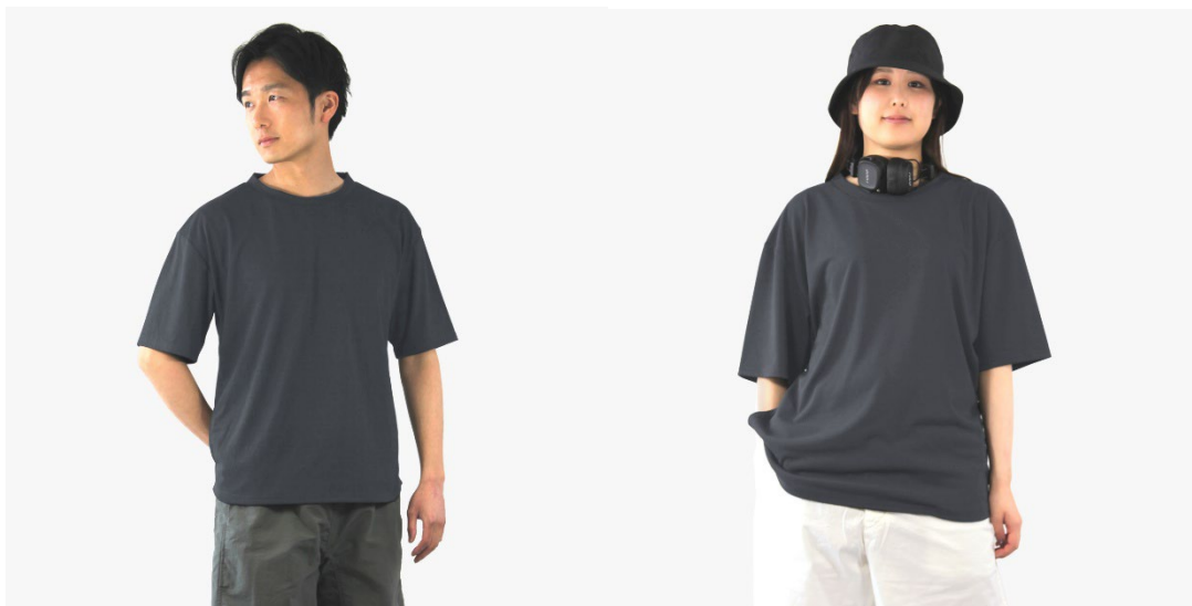
写真は、34.チャコール カラー