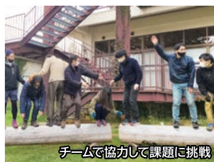
チームで協力して課題に挑戦