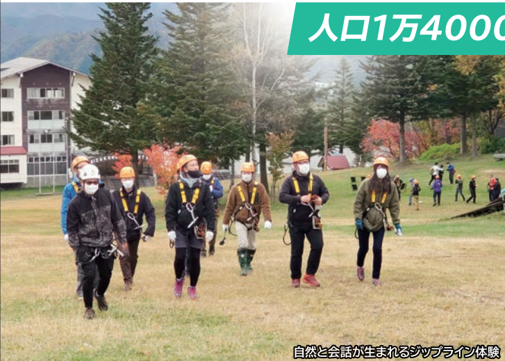
自然と会話が生まれるジップライン体験