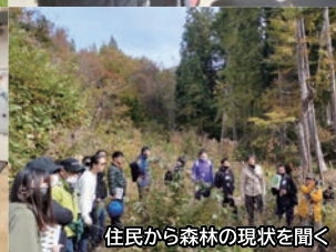
住民から森林の現状を聞く