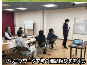
グループワークで町の課題解決を考える