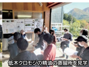
低木クロモジの精油の蒸留所を見学