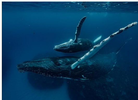
第39回プリント部門 最優秀賞 『背中合わせ』平嶋 善隆