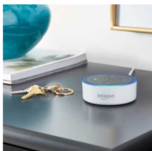
Amazon Echo Dot

今回、Alexaに対応することで、屋内ではスマートフォンなしでもEchoを通じて音声で呼び出し、ハンズフリーでニュースが聞けるようになりました。