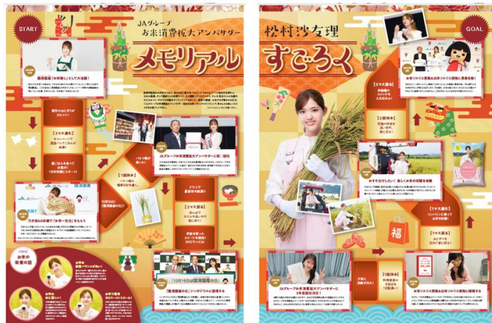
フロント面を開いた中面