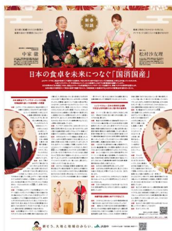
フロント・最終面