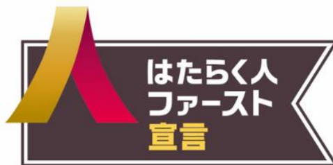
「はたらく人ファースト宣言」バッジイメージ