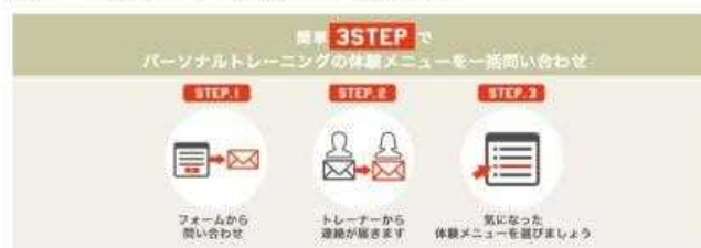
体験トレーニングメニュー問い合わせの仕組み