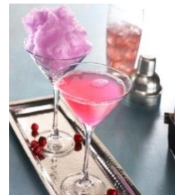
「ピンクパンクコスモ」

「TGI フライデーズ」では、2月24日(金)15～18時の時間帯限定でアルコールドリンクメニューがすべて半額となる『プレミアムフライデーズ』を実施します。「TGI フライデーズ」の店舗スローガンは「Thank Goodness It's Friday (やったー！今日は金曜日だ!)」です。いつもより早い15時に退社したビジネスマンやOLが「プレミアムフライデー」を大切な人と楽しんでいただける機会を設けたいと考えました。口の中ではじけるタイプのわたがしを使用し、口の中でパチパチと音がする人気の「ピンクパンク コスモ」など、気になっていたカクテルをこの機会にチャレンジできます。