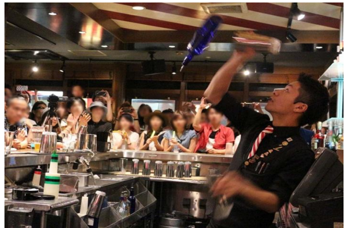
「TGI フライデーズ」で楽しめるフレアーバーテンディング