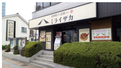
「ミライザカ」でも利用できます