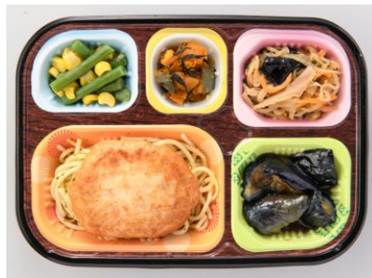
献立例：豆腐ハンバーグ