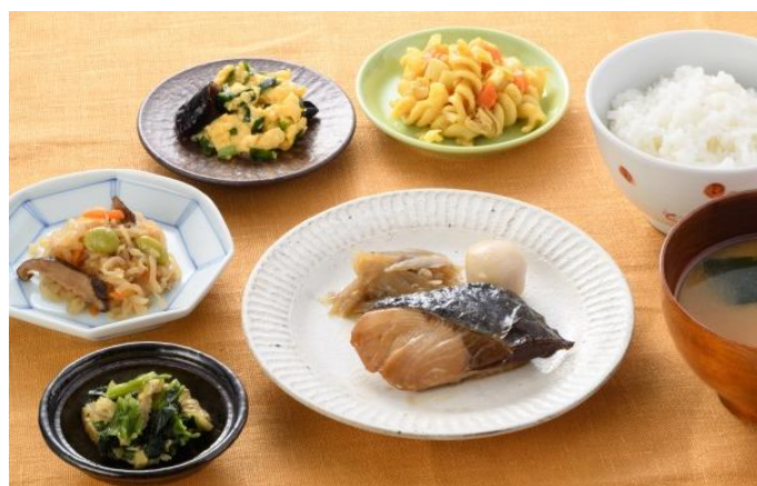
右写真は、「ワタミの宅食ダイレクト」商品 盛り付けイメージ (写真は「おまかせコース」の「ブリの照り焼き」) ※ご飯、お味噌汁、食器は商品に含まれておりません。