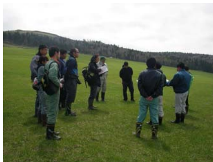
4者現地視察の様子