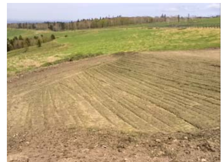
飼料作物栽培を行うために客土した畑