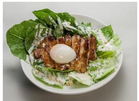
「有機ロメインレタスとケイジャンチキンの ごちそうシーザーサラダ」