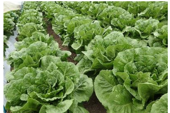
ワタミファーム東御農場の「有機ロメインレタス」