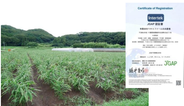
ワタミファーム白浜農場(千葉県)

ワタミグループでは、「お客様に、安全・安心に配慮した食材を使った料理を提供したい」との思いを実現するべく、2002 年より農業に取り組んでいます。2017 年 11 月から JGAP 認証の取得を進めており、全国の全 12 農場でも JGAP 認証を取得することで、より信頼性の高い生産管理体制を構築して安全な農作物の生産に取り組んでまいります。