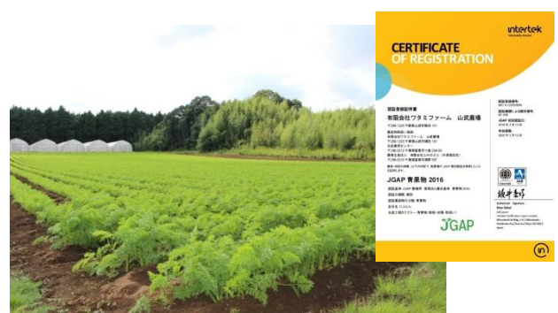
ワタミファーム山武農場(千葉県)