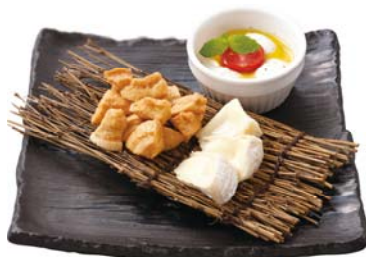
ふわとろモッツアレラ& 生カマンベール盛合せと もちっぷす生キャラメル (590円税別)