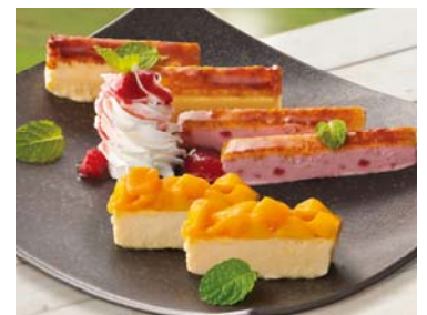
花畑牧場のカタラーナプレート (580円税別)