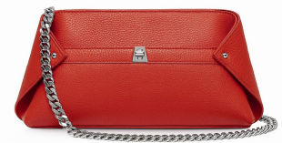
ニューモデル「チェーンアイ」

10 月 1 日の一般発売に先駆けて、ポップアップストアで予約を承ります。レディライクでありながらモダンな「チェーンアイ」をいち早くゲットして！