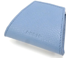
オリジナルコインパース