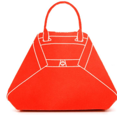
スイーツ入りペーパーボックス

ストアでハンドバッグをトライアルして、簡単なアンケートにこたえていただいた方に「アイ」をかたどったペーパーボックス(カラフルなスイーツ入り)をさしあげます。