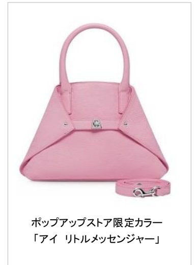
ポップアップストア限定カラー 「アイ リトルメッセンジャー」

ブランド名 Akris の頭文字<A>を模った「アイ」は、ユニークなデザインが特長です。留め金はずし、折りたたんだバッグの両端を広げると、トートバッグに変化するフォルム。メッセンジャータイプには、取り外し可能なストラップが付き、ななめ掛けをすればスポーティな印象にも。今回のポップアップストアオープンを記念して、世界でもここではか手に入らない限定カラー(バラガン・ピンク)の「アイ リトルメッセンジャー」(¥134,000 税抜 写真・右)をご用意しております。