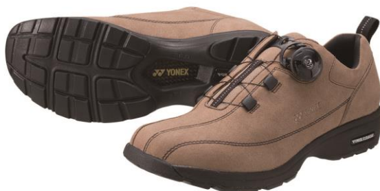
男性用 MC68 サンドベージュ