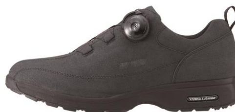
男性用 MC68 チャコールグレー

※Boa ® 及び Boa ® のロゴは、全て米国 Boa Technology 社の登録商品です。