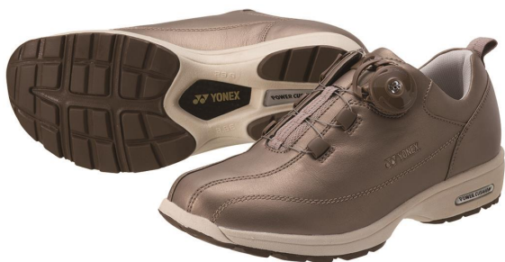
女性用 LC68 パールカーキ