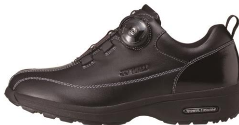
女性用 LC68 ブラック