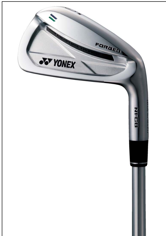
↑ N1-CB フォージドアイアン

最大の特徴は、フェース裏側に複合させたグラファイト制振材にあります。スリット内部にグラファイト制振材を複合することで、振動を抑え打球感が向上するのに加え、低・深重心化が可能となり、見た目以上のやさしさを実現しました。