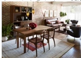
『Chic Modern Style』

女性のための快適住まいづくり研究会が運営する自由が丘「サクラティアラマンションサロン」と連動したコラボブースを有明本社ショールーム内に展開。住まいづくり研究会と大塚家具のコラボレーション企画により、自分らしく選べるセレクトを6タイプご提案しています。