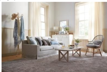
『Shabby Chic Style』