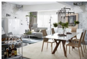
『Urban modern Style』