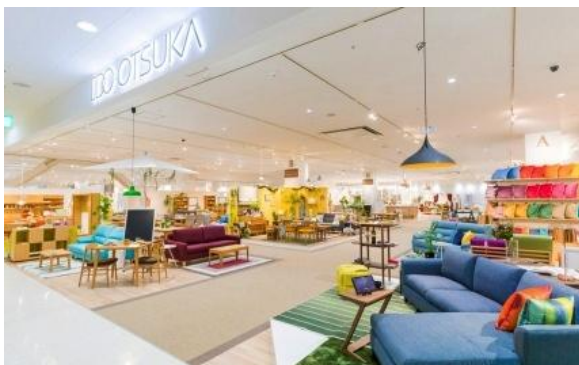
南船橋店 (2016年9月オープン) 約4,600㎡

< 当社商品展示店 > DEJIMASTOCK (広島県広島市) ・ヤマトヤシキ姫路店(兵庫県姫路店)