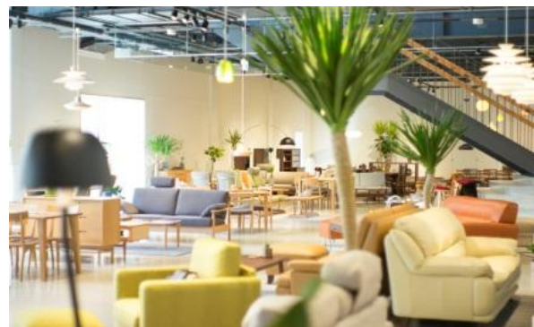
DEJIMA STOCK(提携店) (2016年10月オープン) 約1,000㎡