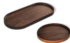
Gli Oggetti- Zhuang