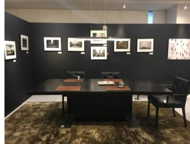
WITTMAN with Art