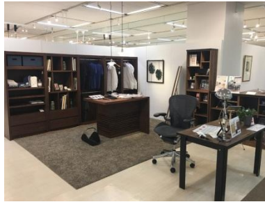
洋服好きのプライベートルーム提案