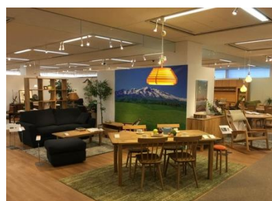
旭川家具のフロア