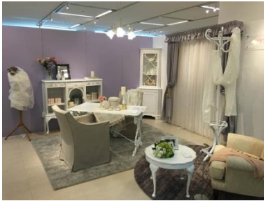
シャビーシックなコンパクトリビング提案

3階の専門ショップフロアでは、快適な住まいづくりのヒントやアイデアがわかる「住まいるステーション」をリニューアル。レイアウトの変更や収納家具の活用による「リフォームいらずのお悩み解決策」や、家具リフォームによる「インテリアのイメージチェンジ提案」、置き家具を用いた「クローゼット収納のヒント」など、お客様が日々の暮らしのなかで感じているご不満を解消し、暮らしを快適にさせていただくための新たなご提案をいたします。