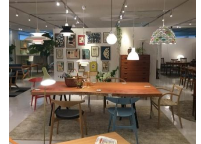
Scandinavian design with Art