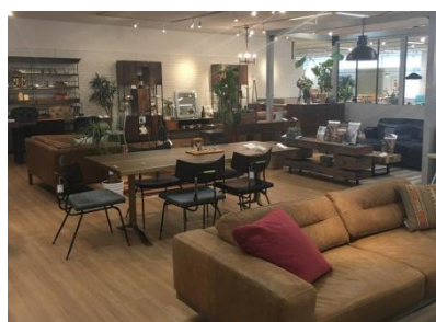
インダストリアル系ファニチャー

多種多様なインテリアを揃えた4階フロアでは、従来の「スタイル別」中心の構成を見直し、「壁面収納」「国産家具」「ワークチェア」などお客様のニーズが高い様々な切り口のゾーンを加えて再構成し、お客様がより見やすく、選びやすいフロアを目指しました。ニーズの高い「国内の優良産地家具」、「セミオーダー家具」、「ワークチェア」、「ユニット収納家具」などの品揃えも拡充し、トレンドの「インダストリアル系家具」の売場も新設いたしました。