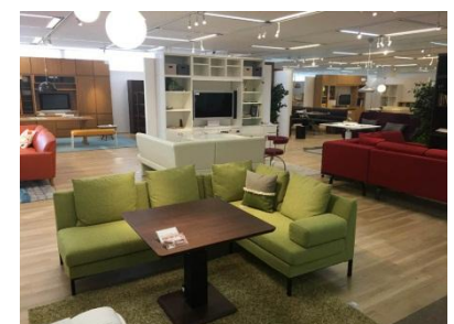
ユニット収納とラウンジスタイル