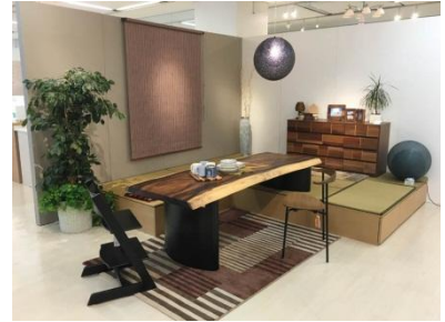
親子3世帯の集いの場の提案