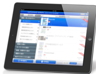
「MR2GO - DMV」イメージ

DMVとはDigital Material Viewerの略で、ゲーム業界で研ぎ澄まされた先進的なUI（ユーザインタフェース）と高パフォーマンスなビューアエンジンにより、iPad等のタブレット端末上で、各企業が持つPDF等のデジタル資産の快適な閲覧を可能にするプレゼンテーションシステムです。クラウド連動による即時反映型のネットワーク同期により、常に最新の資料への更新が可能です。