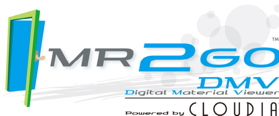
「MR2GO - DMV powered by CLOUDIA」製品ロゴ

MR は、自社の医薬品の情報を医師などの医療従事者に提供することを主な業務とし、いかに短時間で効率よく魅力的なプレゼンテーションが行えるかが求められております。