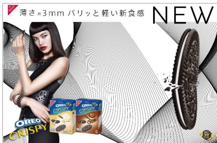
「オレオ クリスピー」キー・ビジュアル

2017年3月6日(月)より TVCM 放映開始、インパクトある 00H も主要駅に登場