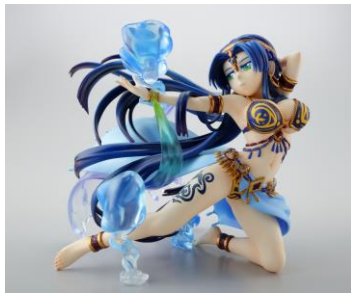
©mixi, Inc. All rights reserved.