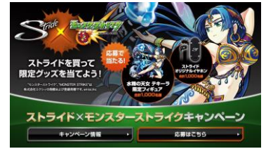
応募画面（イメージ画像）

<「水精の天女 テキーラ」限定フィギュアまたはストライドオリジナルイヤホンが当たる！>