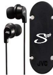
ストライドオリジナルイヤホン（イメージ画像）

モンスターストライク（ http://www.monster-strike.com/ ）