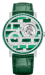
G0A49118 Altiplano Precious Skeleton High Jewelry Watch