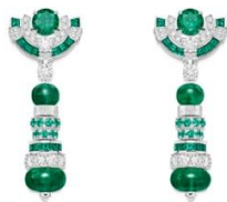
G38T8900 Glowing Weave Earrings