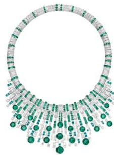
G37T2300 Glowing Weave necklace