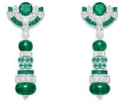
G38T8900 Glowing Weave Earrings

「ピアジェの過去と現在が華やかに融合する場所」というコンセプトのもと、このコレクションは1960年代と1970年代の大胆さ、活気、芸術的自由からインスピレーションを得ています。ピアジェのクラフツマンシップ、芸術性、ファッションとの関わりを凝縮し、喜び、輝き、若々しいスピリットを表現しています。