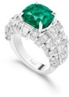
G34Q16 Glowing Weave Ring

その前日、イ・ジュノはエメラルドをセットした「アルティプラノ プレシヤス ウォッチ」とブローチのようにスタイリングされた「グローイング ウィーブ イヤリング」を着用してガラ・ディナーに出席し、まばゆい印象を残しました。