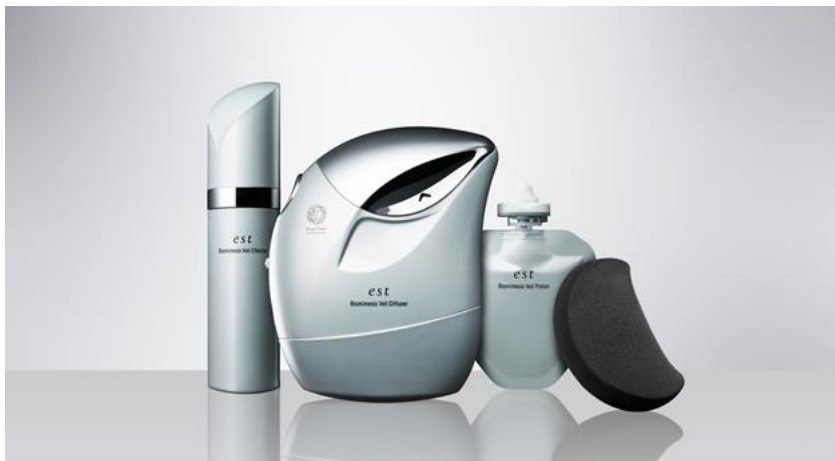
写真右:「エスト バイオミメシス ヴェールアプリケーター」

花王の百貨店ブランドest(エスト)から、2020年9月4日、「Fine Fiber Technology(ファインファイバーテクノロジー)」を応用した「エスト バイオミメシス ヴェール」の新アイテムとして、目もとや口もとなど、直接ヴェールをふきつけにくい部位にまで、ヴェールを貼りつけられる化粧道具「ヴェールアプリケーター」(1品種・2,200円〈税込 2,420円〉)を新発売します。