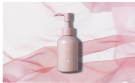
するんと まとまるミルク