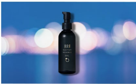
きらりと つやめくオイル

トリートメント※に混ぜても使える、カスタムエッセンス。なりたい仕上がりに合わせて2種類から選べます。