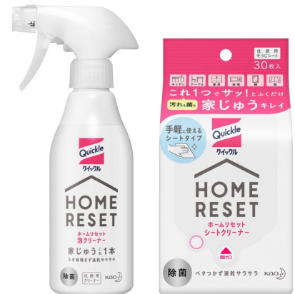
「クイックル ホームリセット」左から、泡クリーナー本体、シートクリーナー

※1 すべての菌・ウイルスを除去するわけではありません ※2 エンベロープタイプのウイルス1種で効果を検証