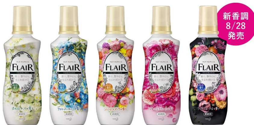
左から、ホワイトブーケの香り、フラワーハーモニーの香り、 ジェントルブーケの香り、フローラルスウィートの香り、リッチフローラルの香り（新発売）