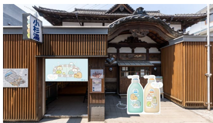
正面エントランス

小杉湯の入口には、公式コラボ暖簾や電光看板にはすみっコぐらしが登場。巨大ボトルパネルを設置し、小杉湯にやってきたすみっコぐらしたちと記念撮影をお楽しみいただけます。脱衣所やロッカー等、小杉湯の色んなところにすみっコぐらしたちが出現し、お風呂に入るまでの瞬間もあたたかく彩ります。