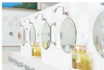
銭湯内装イメージ