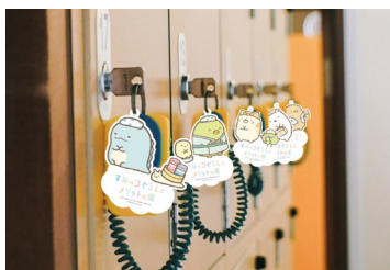
特別バージョンロッカーキー（※12日より設置予定）