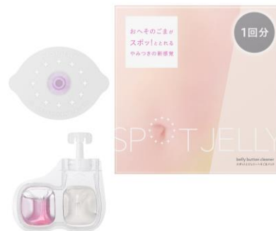
ゼリーポーション 1個 / おへそシール 1枚 × 1セット入