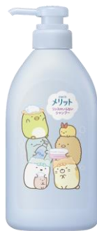
販売名:メリットシャンプーDE2