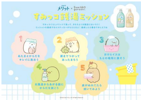
すみっコ銭湯ミッション