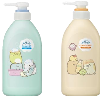
販売名:メリットシャンプーDE1 販売名メリットリンスDE1

販売名:メリットシャンプーDE1、メリットリンスDE1 いずれも【医薬部外品】地肌と髪をすこやかに保つ