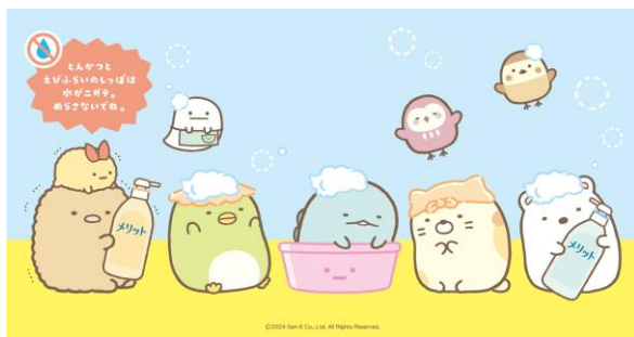
泡インスタレーション