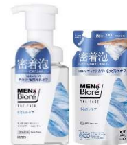
<本体・つめかえ用>