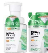
<本体・つめかえ用>