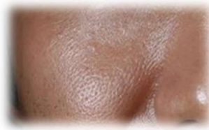
【こびりつき汚れにより、 テカリや毛穴目立ちのある肌のイメージ】

「メンズビオレ ザフェイス」では、男性の肌研究を重ね、花王独自の洗浄技術を応用し、“こびりつき汚れ *1 ”や毛穴汚れまで、しっかりオフできる洗浄力を実現しました。