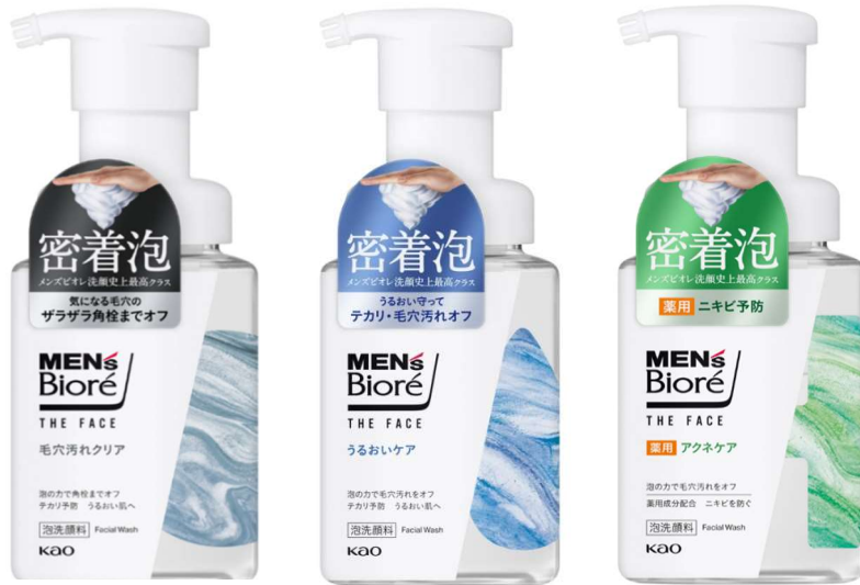
左から「メンズビオレ ザフェイス」 【毛穴汚れクリア】

花王株式会社のスキンケアブランド「メンズビオレ」より、9月に新発売した洗顔料「メンズビオレTHE FACE（ザフェイス）」が、WWDBEAUTY「2024下半期ベストコスメ」ドラッグストア編 メンズコスメ新商品部門で1位を受賞しました。