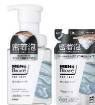
<本体・つめかえ用>