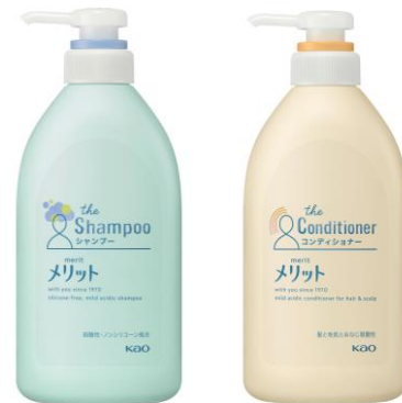
販売名:メリットシャンプー-DEI | メリットリンス DEI