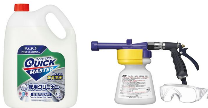
左から、「Quick Master 床用クリーナー」、別売り「Kao フォームガン」