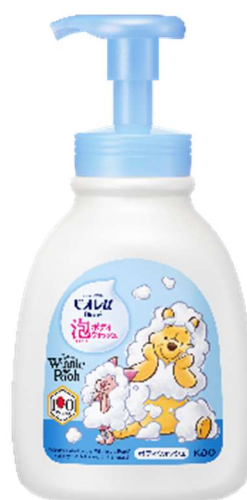
【ビオレ u 泡で出てくる！ボディウォッシュ やさしいフレッシュフローラルの香り プーさんデザイン】