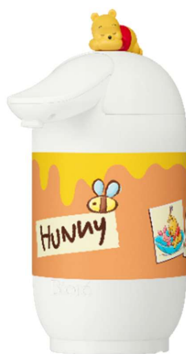
【ビオレ u 自動で出る泡ハンドソープディスペンサー プーさんデザイン】

花王株式会社のスキンケアブランド「ビオレ」は、2026年4月11日、『ビオレ u 自動で出る泡ハンドソープディスペンサー』と『ビオレ u 泡で出てくる！ボディウォッシュ』から「プーさんデザイン」を数量限定で発売します。