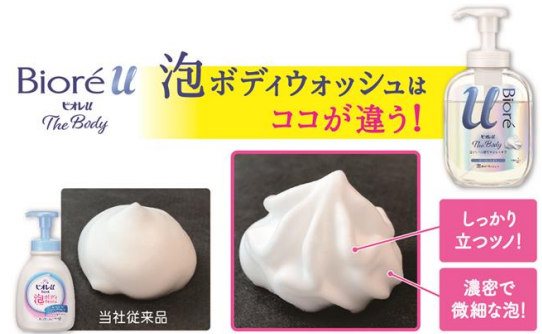
<泡タイプの泡のイメージ>

液体タイプには、植物由来の泡立ち成分を配合し、素早くシルクのような泡を作り出せます。