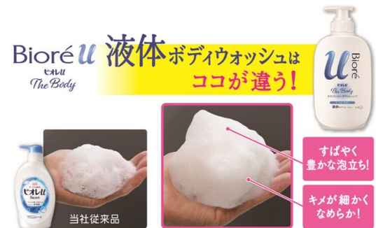
<液体タイプの泡のイメージ(ボディタオルで泡立てた場合)>

液体タイプには、植物由来の泡立ち成分を配合し、素早くシルクのような泡を作り出せます。