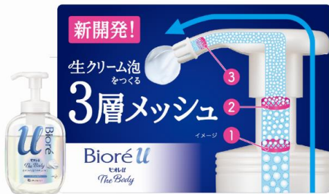
<泡タイプの3層メッシュポンプの機構(イメージ)>

泡タイプは、ビオレu史上初、“生クリーム泡”を作る3層メッシュポンプを採用。一目で違いのわかる“生クリーム泡”を作ることができます。