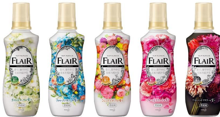
新「フレア フレグランス」左から、ホワイトブーケの香り（新香調）、フラワーハーモニーの香り、 ジェントルブーケの香り、フローラルスウィートの香り、ベルベットフラワーの香り