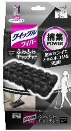
クイックルワイパー ふわふわキャッチャーシート ブラックカラー