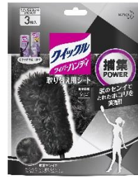
クイックルワイパー ハンディ 取り替え用シート ブラックカラー