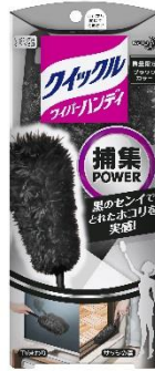
クイックルワイパー ハンディ 本体 ブラックカラー