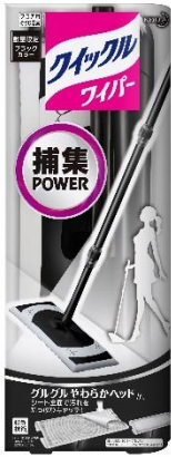
クイックルワイパー 本体 ブラックカラー