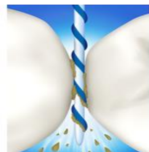
立体フロスマが歯間に届いて汚れを からめとる (イメージ)