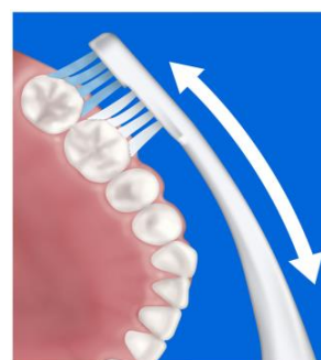
ロングカーブネックで奥歯に届く (イメージ)